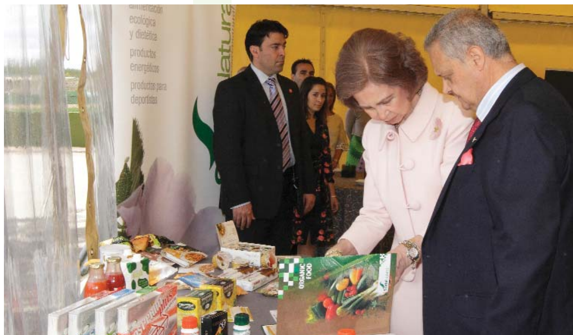
La Reina observa detenidamente una muestra de los productos de Soria Natural