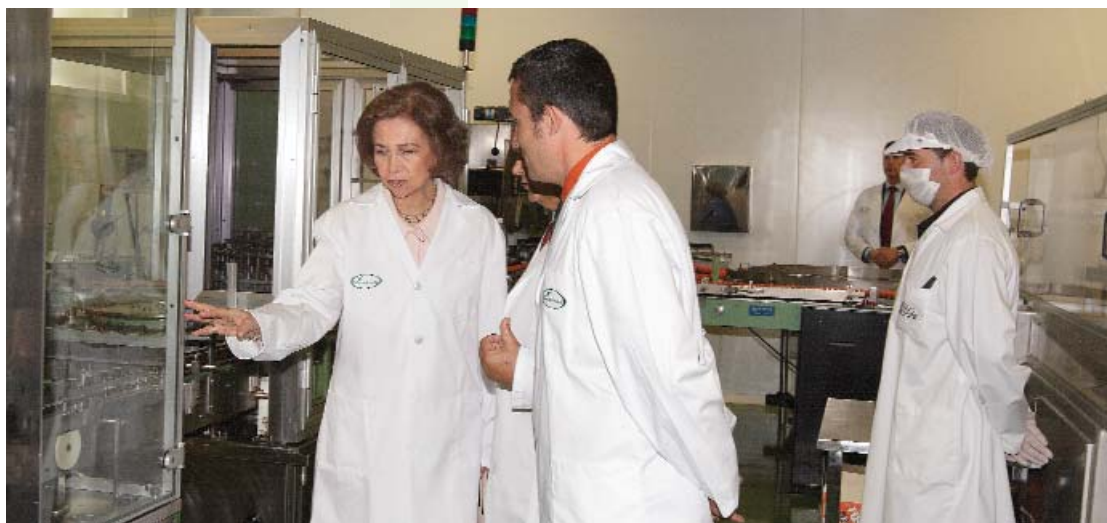
La Reina, en la sala de fabricación del Fost Print, uno de los productos emblemáticos de Soria Natural. Debajo, doña Sofía observa cómo trabajan dos empleadas, con quienes departió durante varios minutos