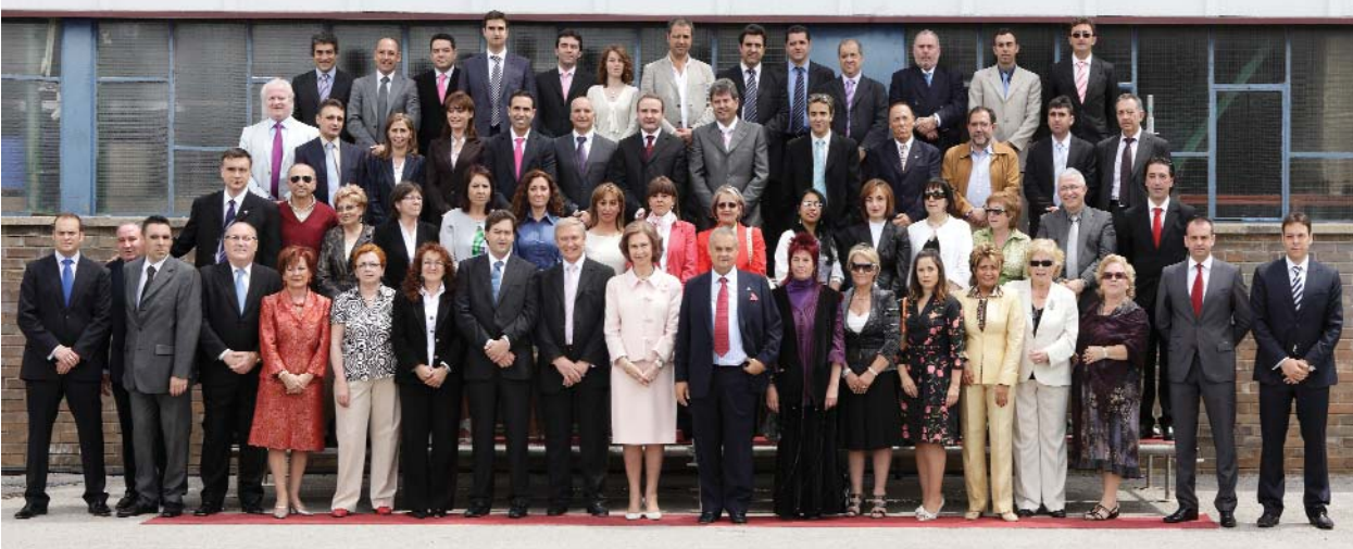
Dofía Sofía también quiso hacerse una fotografía con un grupo de clientes