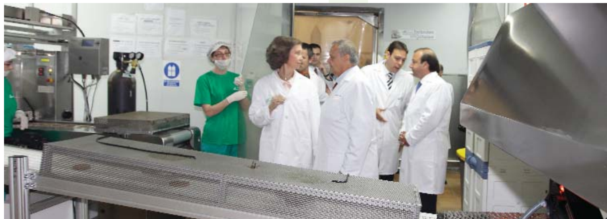
La Reina, en la sala de fabricación de hamburguesas vegetales